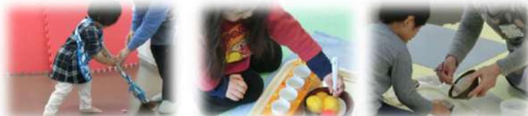
活動例：お掃除、ごますり、手先を使うお仕事にチャレンジ