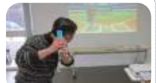
Wiiスポーツを大画面で