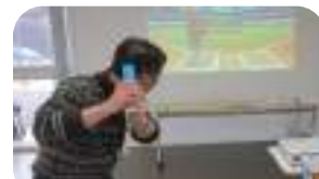
Wiiスポーツを大画面で